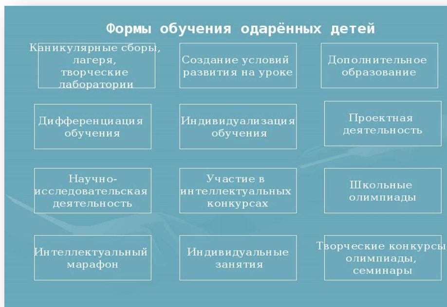
Рис.1 Формы обучения одарённых детей в Приволжском районе.

их индивидуальных склонностей. В системе дополнительного образования мы выделяем следующие формы обучения одарённых детей: